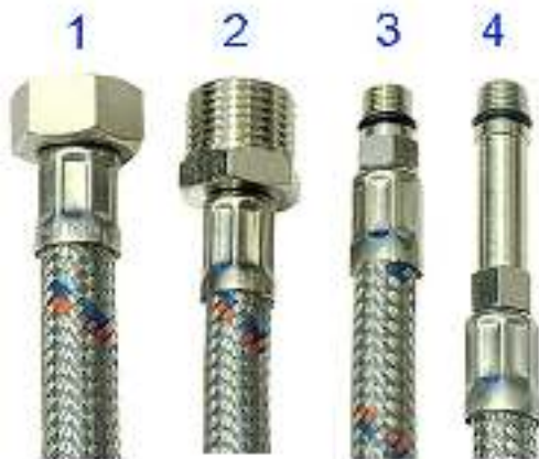
ПОДВОДКА ГИБКАЯ ДЛЯ ВОДЫ

Произведено по технологии: VALTEC s.r.l., Via Pietro Cossa, 2, 25135-Brescia, ITALY Изготовитель: CIXI SPAIL SANITARY WARE CO., LTD, Xijie Village, Xinpu Town, Cixi City, Zhejiang province, China, 315322